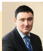
Болотов Руслан Николаевич Первый заместитель Губернатора Иркутской области Председатель Правительства Иркутской области