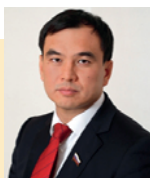
Тен Сергей Юрьевич Депутат Государственной Думы Федерального Собрания Российской Федерации

В программу, возможно будут внесены изменения*