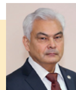
Сулейменов Артур Мухтарович Министр жилищной политики, энергетики и транспорта Иркутской области